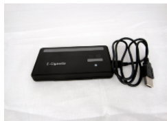
Chargeur portable avec câble USB