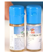
2 flacons de e-liquide Flavour Art