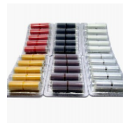
5 cartomiseurs de KR808 (coloris au choix)